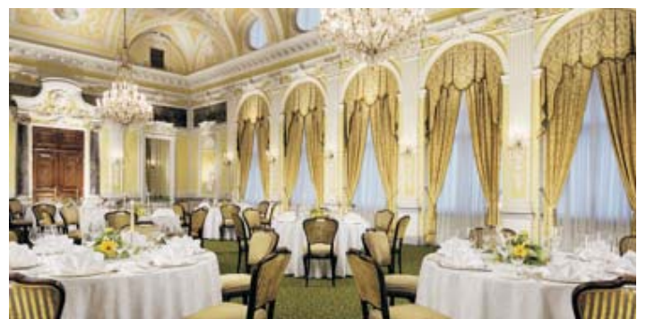
HOTEL EUROPA DE INNSBRUCK