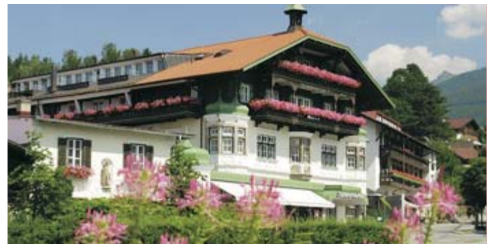
HOTEL SPORHOTEL IGLS